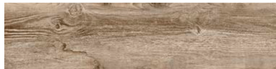
4421 - 30X120/12"X48" NATURALE RETTIFICATO ■ 162