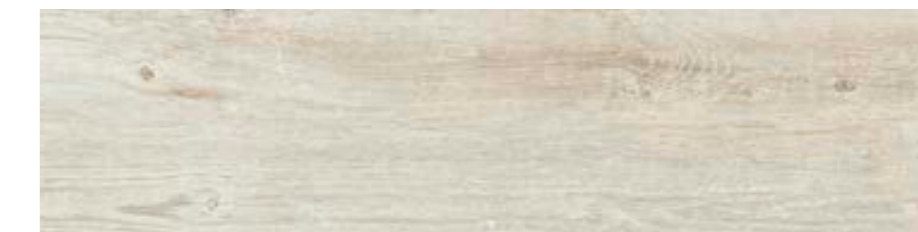
4505 - 30X120/12"X48" NATURALE RETTIFICATO ■ 162