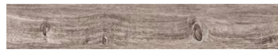
4428 - 20X120/8"X48" NATURALE RETTIFICATO ■ 162