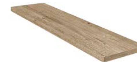
30X120/12"x48" ANGOLAE GRADONE COSTA RETTA ▲ 199