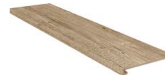
30X120/12"x48" GRADONE COSTA RETTA ▲ 196