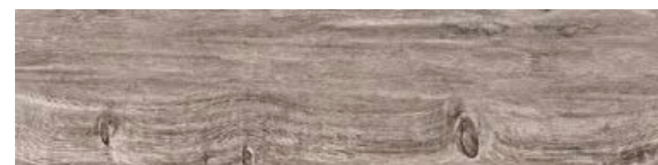
4424 - 30X120/12"X48" NATURALE RETT. OUT R11 ■ 162