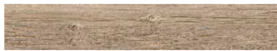
4427 - 20X120/8"X48" NATURALE RETTIFICATO ■ 162