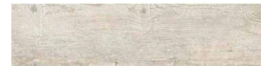
4506 - 30X120/12"X48" NATURALE RETT. OUT R11 ■ 162