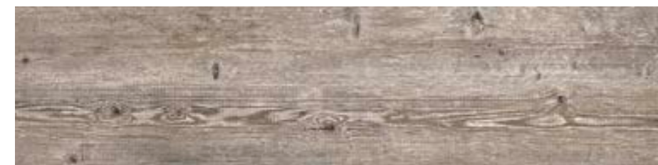
4423 - 30X120/12"X48" NATURALE RETTIFICATO ■ 162